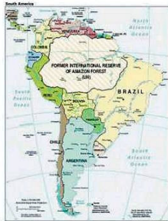
map 3.5.5.1- We can see the location of the International Reserve. It look area of eight South America's countries: Brazil, Bolivia, Peru, Colombia, Venezuela, Guyana, Guiname and F.Guyana. Some of the poorest and miserable countries of the world.

The creation of FINRAF were supported by all nations of G-23 and was really a special mission of our country and a gift of all the world, since the possession of these valuable lands to such primitive countries and people should condemn the lungs of the world to disappearance and full destroying in few years.